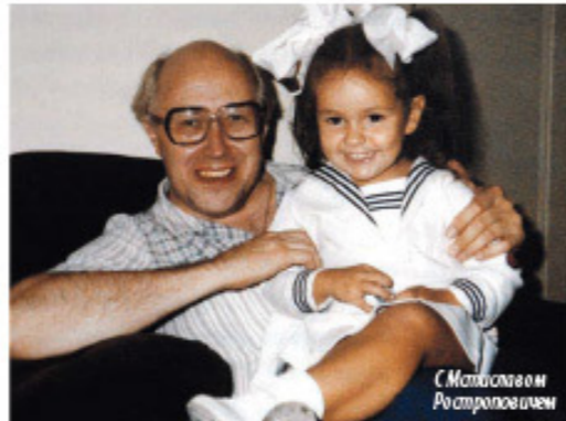
С Михаилом Ростроповичем