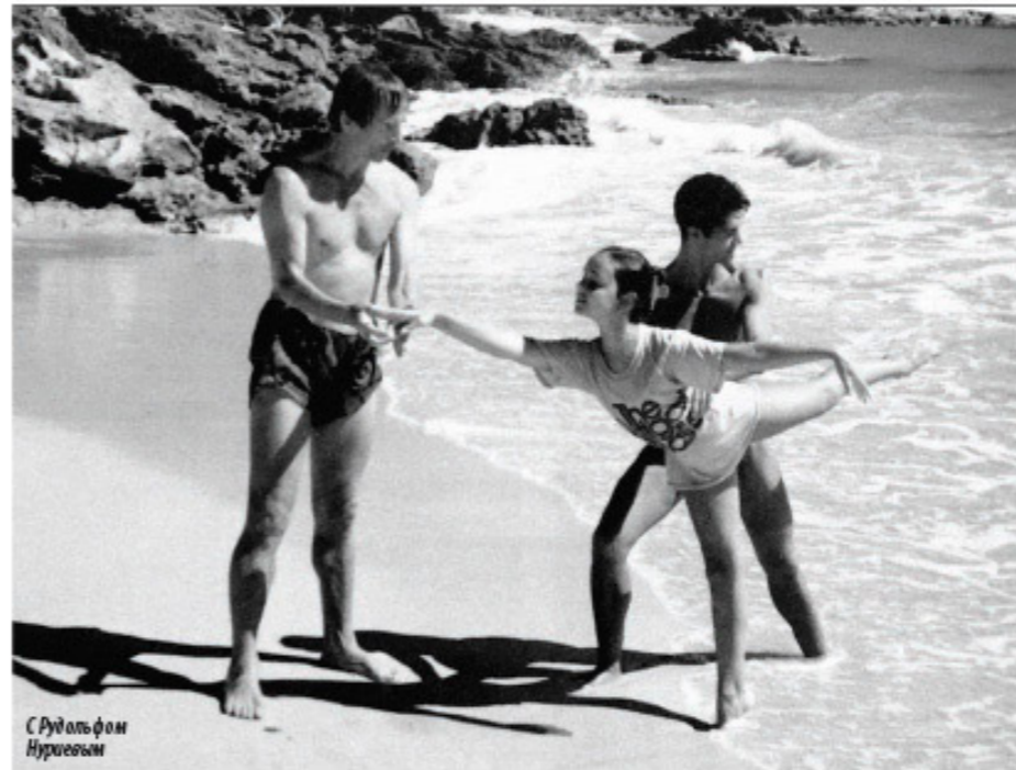
С Рудольфом Нуриевым